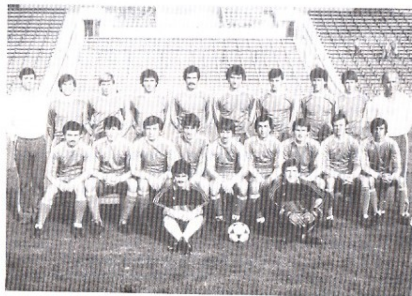
Представителният футболен отбор на ЦСКА „Септемврийско знаме“ — сезон 1982/83 г.

Петър Жеков — „Златна обувка“ за 1969 г. и „Бронзова“ за 1970 г. и 1973 г.